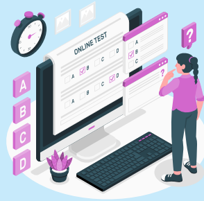
Online Test Series & Quiz